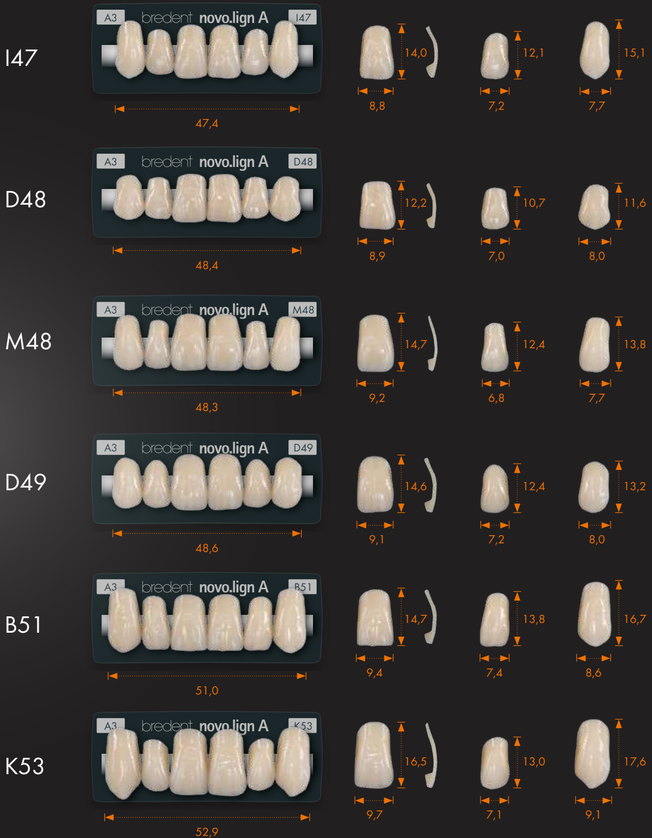
Imagen 1:1, medida en mm

Grosor de la faceta en la zona cervical y zona central de 1 mm